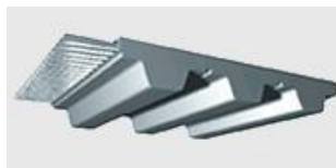
Passo T 2,5

Fabricação: Poliuretano com cordonéis em aço